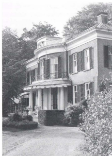
De voorgevel met nog de oorspronkelijke gevelbekroning.